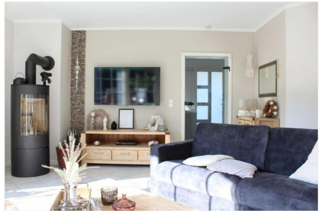
Wohnbereich TV und Kamin